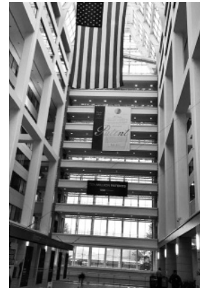
景気よさを 感じさせるビル内部